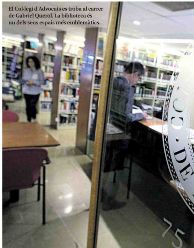
El Col·legi d'Advocats es troba al carrer de Gabriel Querol. La biblioteca és un dels seus espais més emblemàtics.