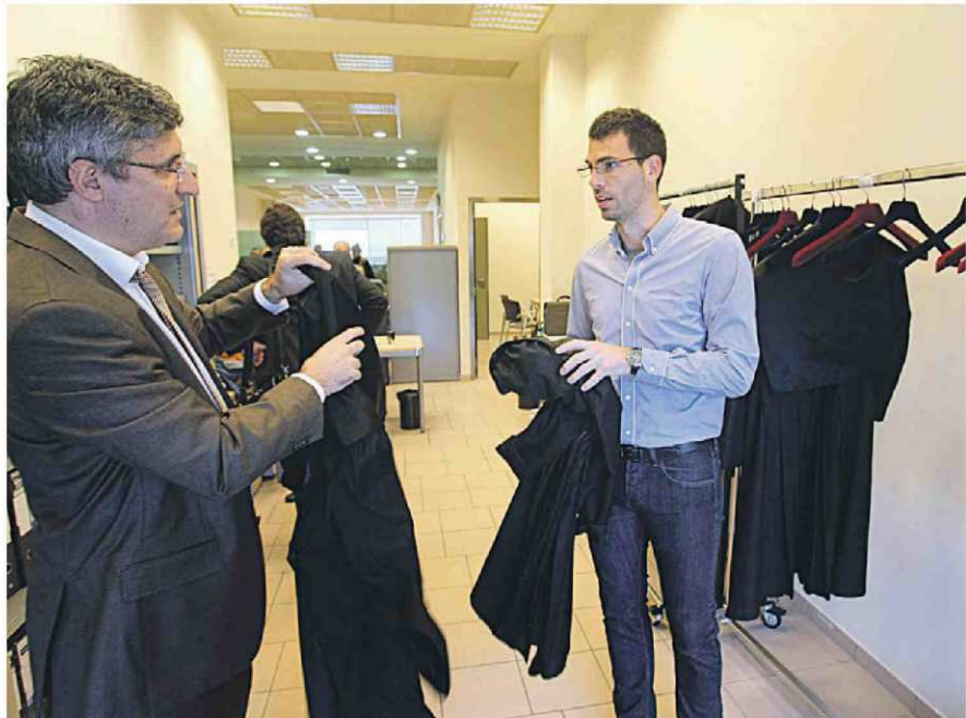
Instal·lacions de la seu del Col·legi d'Advocats de Terrassa als Jutjats de la ciutat. NEBRIDI ARÓZTEGUI

El benefici de la justícia gratuïta pot basar-se en una concessió dels tribunals (és la regla general) o en una disposició legal (l'excepció).